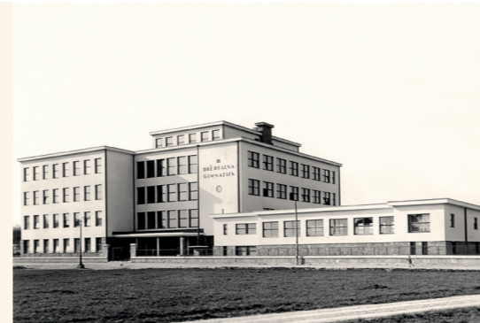
Sonja Lapajne Oblak (Ljubljana, 1906–1995)