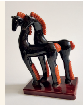
Dana Pajnič (Ljubljana, 1906–1970)